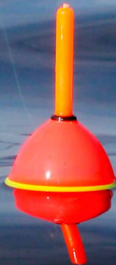
Bolvormige dobbers met een goed zichtbare antenne genieten de voorkeur.

TEKST: TIES ITTMANN > ILLUSTRATIE: EMIEL VAN DIJK