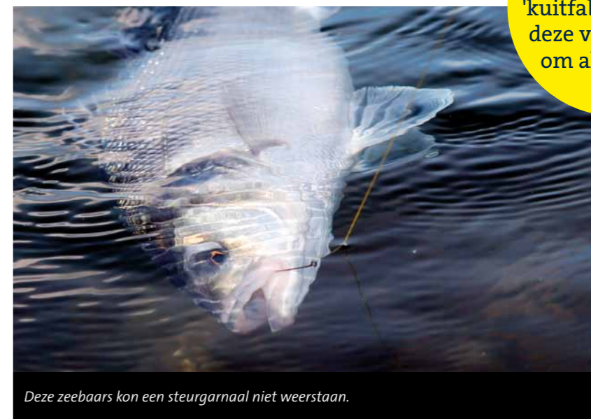
Deze zeebaars kon een steurgarnaal niet weerstaan.

Grote zeebaarzen zijn 'kuitfabrieken', zet deze vissen daarom altijd terug