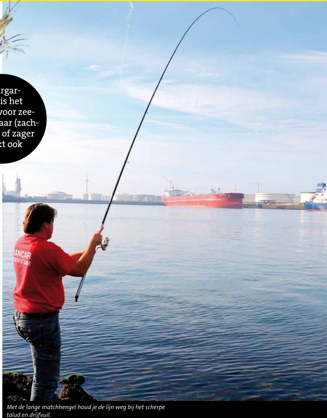
Met de lange matchhengel houd je de lijn weg bij het scherpe talud en drijfvuil.

Steurgarnaal is het topaas voor zeebaars, maar (zachte) krab of zager werkt ook