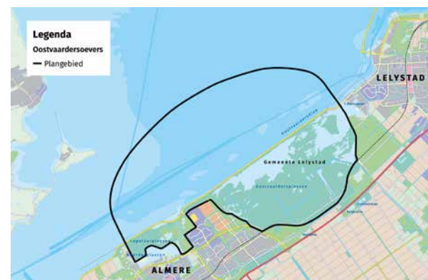
In het Oostvaardersoeverproject wordt het relatief voedselarme Markermeer functioneel verbonden met de voedselrijke Oostvaardersplassen.

De verdieping van kennis en inzichten is van belang om meer grip te krijgen op de aard en omvang van heldere en eenduidige maatregelen voor ecologisch herstel in het IJsselmeergebied. ■