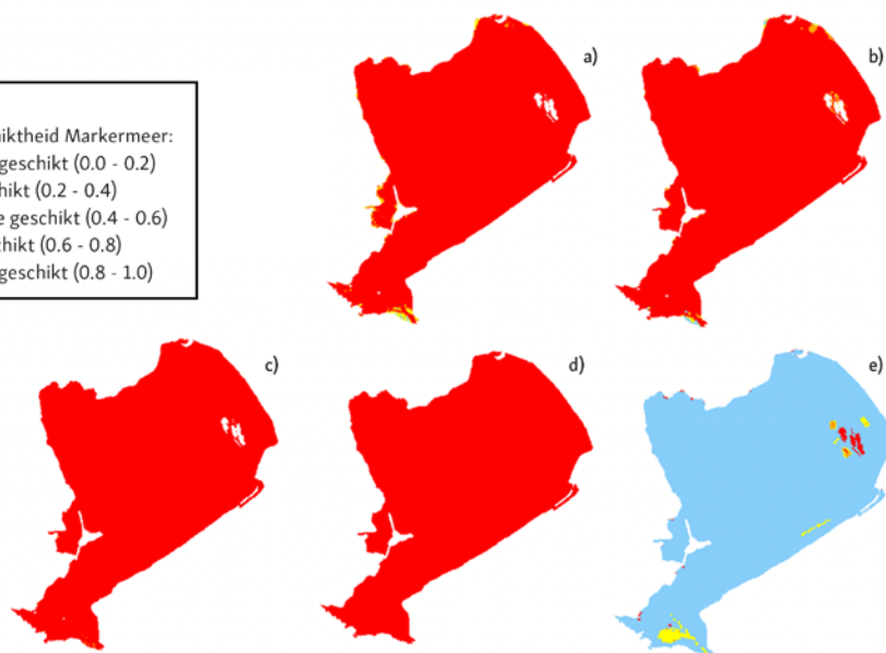
Habitatgeschiktheid van de vijf doelsoorten voor het Markermeer. De habitatgeschiktheid is gecategoriseerd van minimaal tot optimaal geschikt met bijbehorende indexwaarde (0-1). a) is de brasem, b) is de blankvoorn, c) is de snoek, d) is de spiering en e) is de zwartbekgrondel.

overeenkomstig met de resultaten van de literatuurstudie. Voor de juveniele aal is in het voorjaar een duidelijk patroon zichtbaar: jonge aal zwemt dan massaal naar binnendijkse wateren als opgroei habitat, terwijl volwassen aal in het najaar in grote getalen in de omgekeerde richting trekt. Bij paaimigraties lijken zowel een migratie naar de binnendijkse gebieden als naar de oeverzones in de meren een rol te spelen. Het samenscholen van snoekbaars (voorjaar) en snoek (najaar) bij de migratiepunten is waarschijnlijk het best te verklaren uit hun predatiegedrag. Daadwerkelijke migratie van deze roofvissen van binnendijkse wateren naar het IJsselmeer/Markermeer is nooit waargenomen. Tot slot laat het onderzoek zien dat de passagemogelijkheden voor met name grote vissen verbetering behoeft: het aandeel grote vis dat passeert dan wel succesvol migreert, is (veel) lager dan het aandeel grote vissen dat aan de aanbodzijde wordt gemeten.