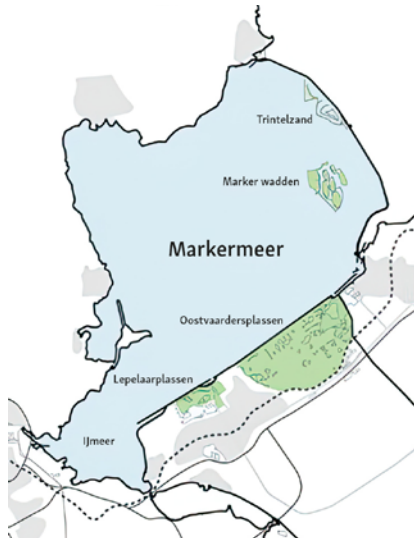
Schematische weergave van het Markermeer met omliggende en inliggende natuurgebieden. (Copyright Mecanoo).

Het Markermeer is voor vissen echter geen homogene bak met water. Zo zijn er verschillende gebieden en ecotopen te onderscheiden, waarbij elke ecotoop ook weer zijn eigen kwaliteiten en functies voor de vis heeft al naar gelang de verschillende levensstadia. De basaldijken worden bijvoorbeeld gekarakteriseerd door het steile talud, hard substraat en een marginale hoeveelheid watervegetatie terwijl het open waterareaal een tamelijk uniform diepteprofiel heeft met een overwegend slibrijke bodem.