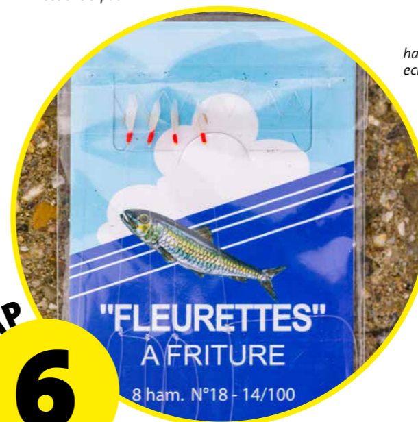
Bij het vissen met kleine haakjes vang je echt niet alleen kleine visjes.