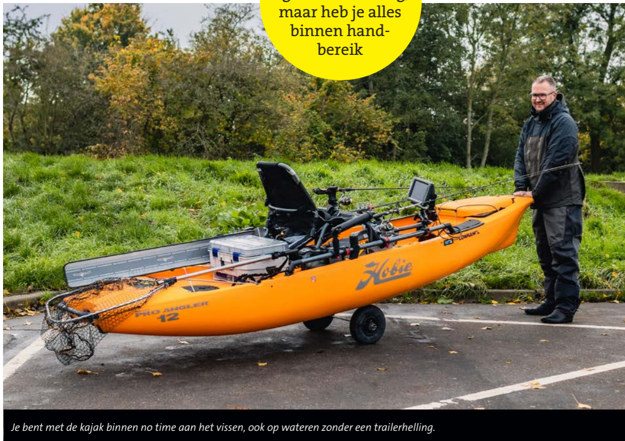
Je bent met de kajak binnen no time aan het vissen, ook op wateren zonder een trailerhelling.

Door het opbergsysteem ligt niks in de weg, maar heb je alles binnen hand- bereik