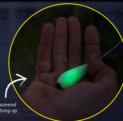
Een experiment met een fluorescerend werpgewicht leverde ook tong op.

TEKST: PIETER BEELEN