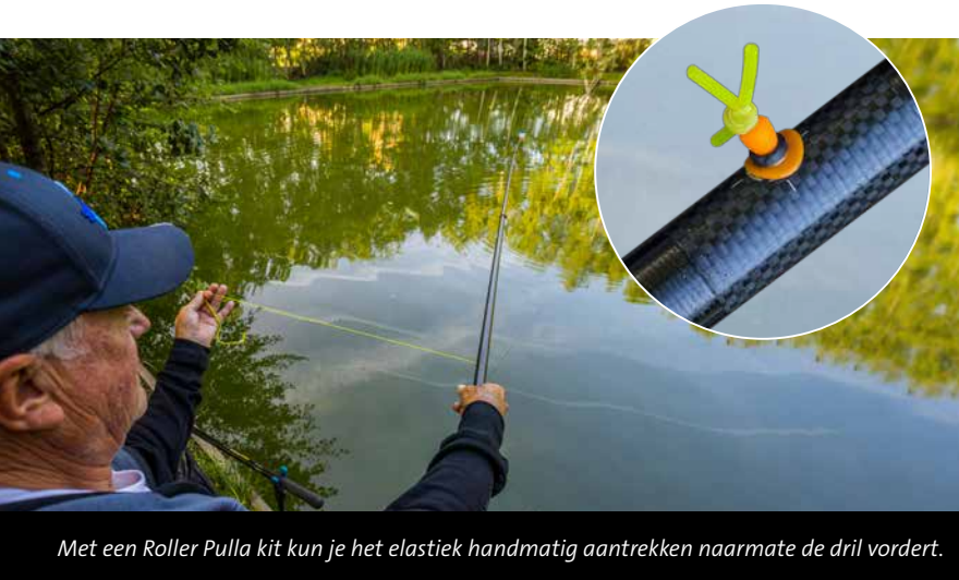
Met een Roller Pulla kit kun je het elastiek handmatig aantrekken naarmate de dril vordert.