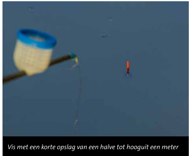
Vis met een korte opslag van een halve tot hooguit een meter

ren.” Daarbij strooit hij nog een paar handjes 2 en 4 mm voerpellets plus wat maïskorrels. Zodra er tuigjes aan de pulla sets zijn gemonteerd, kan het feest beginnen.