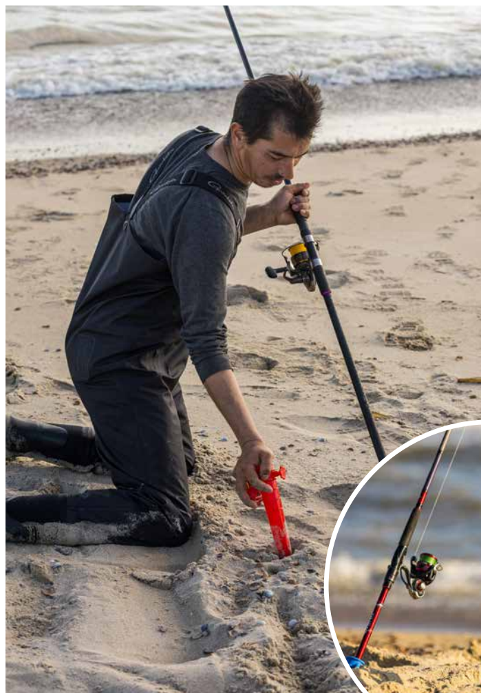
De parasol standaard is een perfecte hengelsteun op het strand.

wat dikkere gevlochten lijn (12/00 of 14/00) is het mogelijk om flink wat druk te zetten." Bovendien heeft de baitcaster een aantal voordelen. "Je kunt heel gemakkelijk met één hand werpen, bent sneller omdat je geen beugel hoeft om te klappen en een kortere hengel is gebruiksvriendelijker. Tel uit je winst."