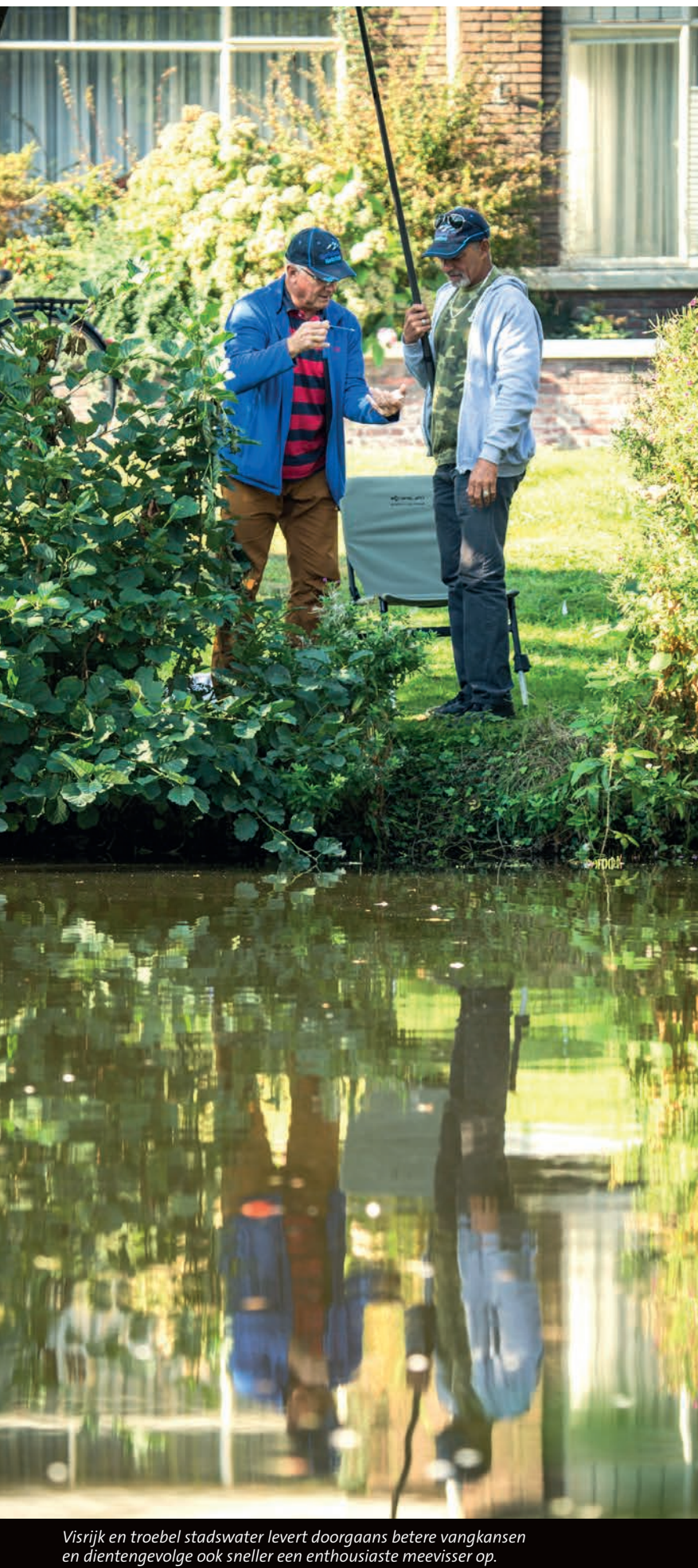
Visrijk en troebel stadswater levert doorgaans betere vangsten en dientengevolge ook sneller een enthousiaste meevisser op.