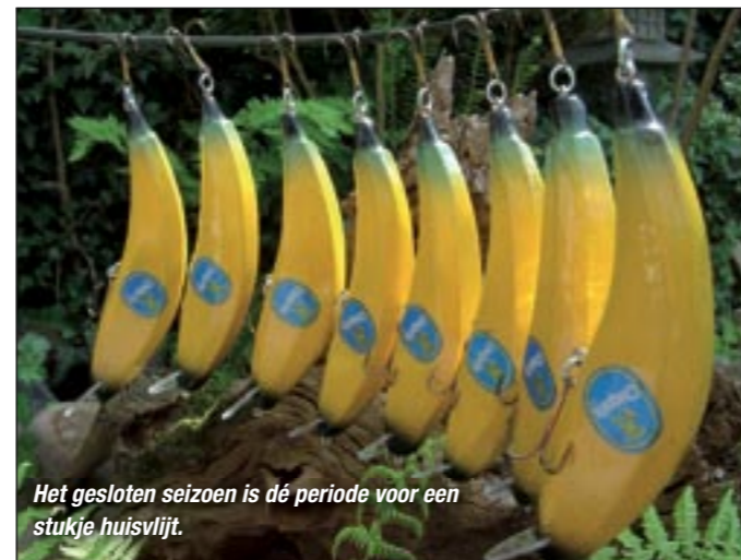
Het gesloten seizoen is de periode voor een stukje huisvljt.

In een catalogus zag ik een keer een plug met de naam 'bananen plug', maar deze was eigenlijk alleen maar krom en leek totaal niet op een banaan. Dat kan anders, dacht ik bij mezelf. In de praktijk bleek het echter makkelijker gezegd dan gedaan om een plug te maken die echt op een banaan lijkt én ook nog een aantrekkelijke actie heeft. Het heeft me dan ook de nodige uurtjes gekost om het lood in de plug op de juiste positie geplaatst te krijgen. Maar het resultaat was alle moeite – inclusief het supermarktbezoek om de stickertjes van de bananen te