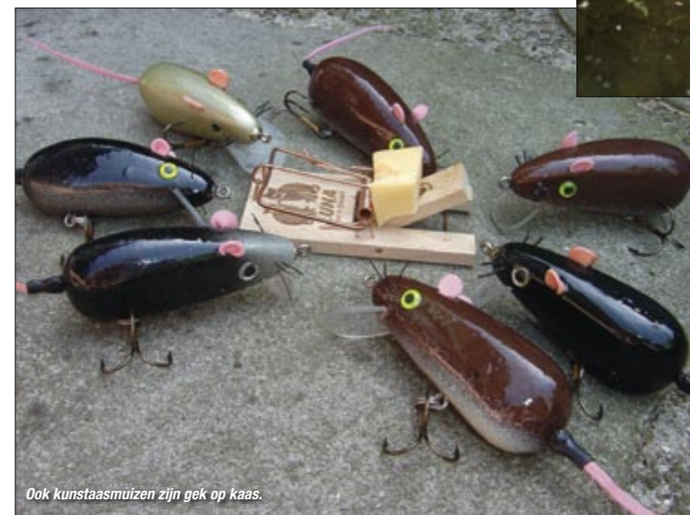
Ook kunstaasmuizen zijn gek op kaas.

'kraagje' voor op de wortel. Let erop dat je dit niet te groot maakt omdat het de actie behoorlijk kan beïnvloeden. Het kraagje zet je met behulp van een schroef vast op de voorkant van de jerkbait. Hierna worden de schroefogen voor de haken geplaatst en kan het geheel worden afgelakt.