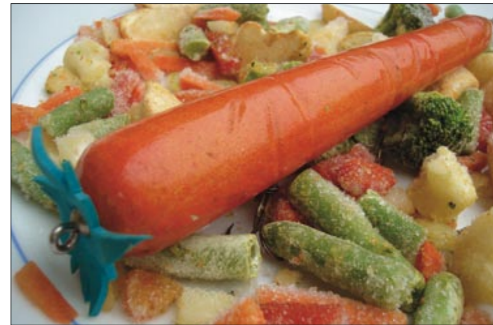
De wortel undercover in een portie diepvriesgroenten.

peuteren – dubbel en dwars waard. De voldoening die je ervaart bij het vangen van je eerste vis aan een eigen fabricaat is onbeschrijfelijk groot. Dit was tot mijn verbazing overigens een snoekbaars. In-