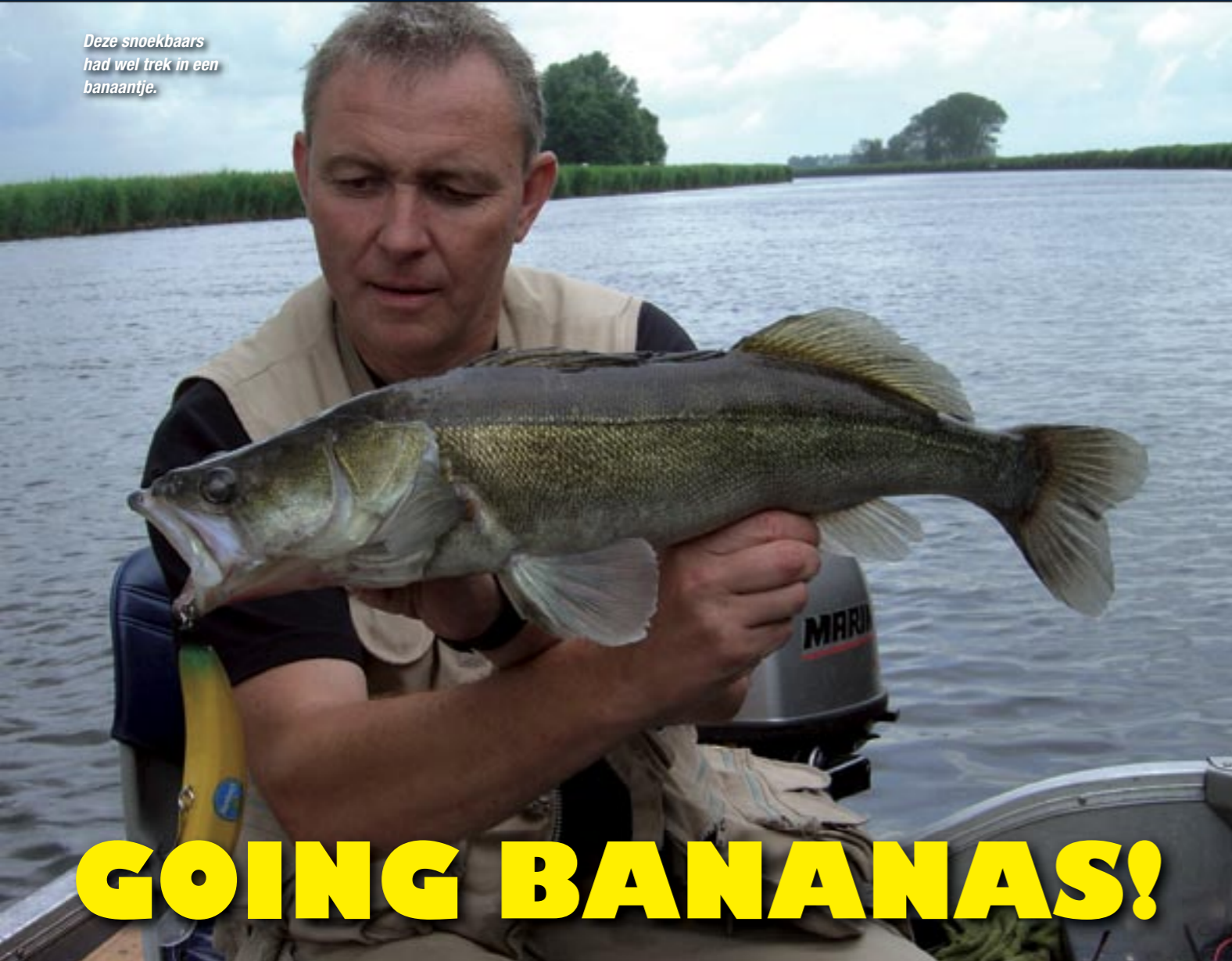
Deze snoekbaars had wel trek in een banaantje.