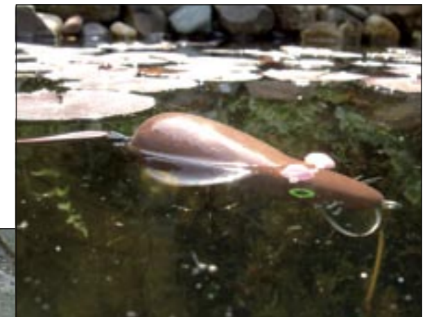
Lood de muis zo uit dat hij net met zijn rug boven water steekt.

Gelukkig zijn niet alle zelfbouwsels zo ingewikkeld om te maken als de bananenplug. Zo vis ik ook met 'de wortel'. Dit is een jerkbait met een walk the dog actie die met korte tikken door de oppervlakte wordt binnen getikt. Een prima aas voor vegetarische snoek die tussen de planten ligt. Een handvat van een oude handveger of een deel van een stoel of tafelpoot voldoet prima voor het maken van een wortel jerkbait. Deze zaag je op een lengte van ongeveer zeventien centimeter af en