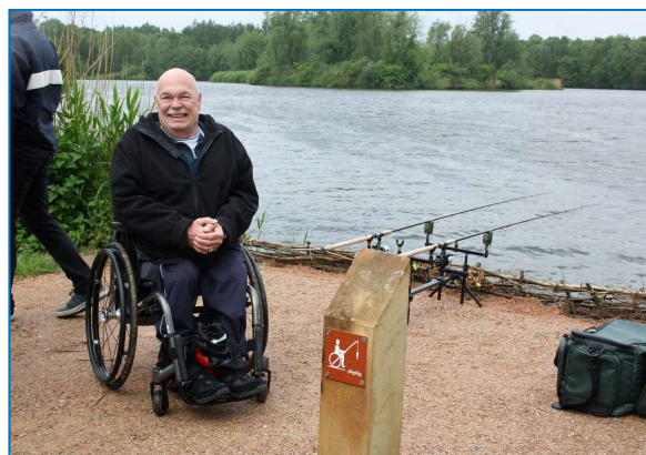
Foto: Halfverharding; Toepasbaarheid: bij alle voorkomende viswateren

Bij de aanvraag van de benodigde vergunningen dient er rekening te worden gehouden met een doorlooptijd van minimaal 8 weken. Deze periode kan wel oplopen tot 6 maanden.