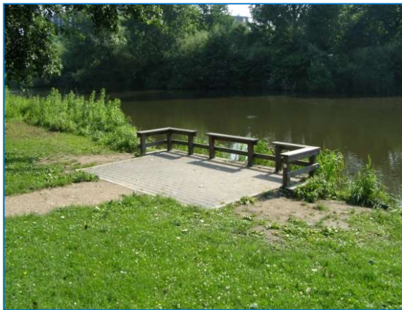
Foto: Elementen-verharding; Toepasbaarheid: bij alle voorkomende viswateren

Tijdens deze fase krijgt de vissteiger of -stoep vorm en dient er nagedacht te worden over de grootte, de vorm en materiaalkeuze. Dit is veelal afhankelijk van het sportvisserijtype waarvoor de voorziening geschikt dient te zijn. Een wedstrijdvisser vraagt bijvoorbeeld minder ruimte dan een karpervisser en andere voorzieningen dan een mindervalide visser. Daarnaast is de huidige oeverinrichting van de locatie bepalend voor het ontwerp. Betreft het bijvoorbeeld een natuurlijke oever met veel waterplanten en/of houtige vegetatie, is er een breed en flauw talud, loopt het talud direct steil af of ligt de locatie aan een dijklichaam.