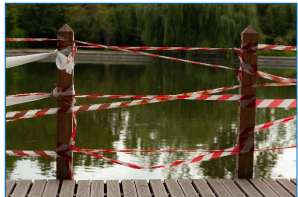
Achterstallig onderhoud kan tot gevaarlijke situaties aan het viswater leiden

Onderhoud aan vissteigers is iets dat vaak over het hoofd wordt gezien, resulterend in vervallen en soms zelfs gevaarlijke vissteigers. Het is dus belangrijk om bij de aanleg van een vissteiger samen met bijvoorbeeld de gemeente of het waterschap de verantwoordelijkheden vast te leggen. Als de gemeente het onderhoud wil uitvoeren, dient er ook formeel te worden vastgelegd dat die verantwoordelijkheid daarmee niet bij de vereniging ligt.