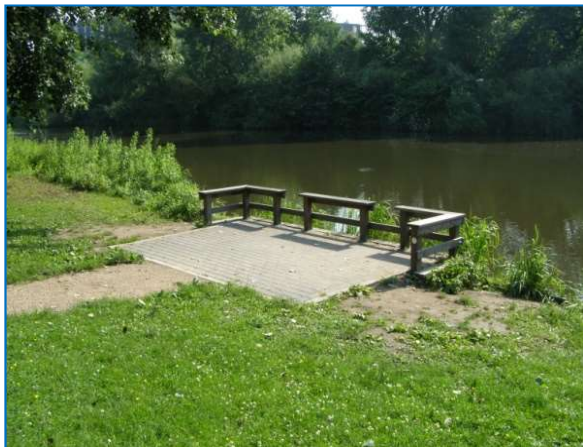
Foto: Elementen-verharding; Toepasbaarheid: bij alle voorkomende viswateren

Tijdens deze fase krijgt de vissteiger of -stoep vorm en dient er nagedacht te worden over de grootte, de vorm en materiaalkeuze. Dit is veelal afhankelijk van het sportvisserijtype waarvoor de voorziening geschikt dient te zijn. Een wedstrijdvisser vraagt bijvoorbeeld minder ruimte dan een karpervisser en andere voorzieningen dan een mindervalide visser. Daarnaast is de huidige oeverinrichting van de locatie bepalend voor het ontwerp. Betreft het bijvoorbeeld een natuurlijke oever met veel waterplanten en/of houtige vegetatie, is er een breed en flauw talud, loopt het talud direct steil af of ligt de locatie aan een dijklichaam.