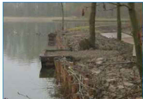
Foto: Halfverharding; Toepasbaarheid: bij alle voorkomende viswateren

Bij de aanvraag van de benodigde vergunningen dient er rekening te worden gehouden met een doorlooptijd van minimaal 8 weken. Deze periode kan wel oplopen tot 6 maanden.