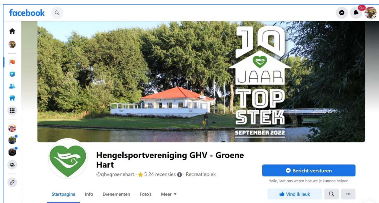
Facebookpagina van GHV -Groene Hart