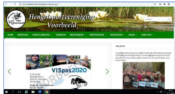
De website van HSV Voorbeeld op desktop

Het spreekt voor zich dat de inhoud van elke verenigingswebsite steeds anders en volledig beheerbaar is.