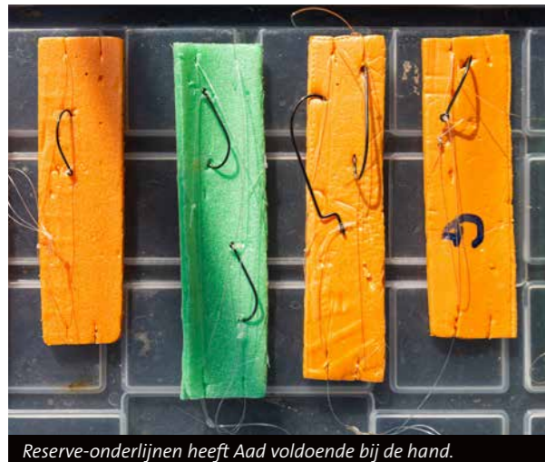
Reserve-onderlijnen heeft Aad voldoende bij de hand.